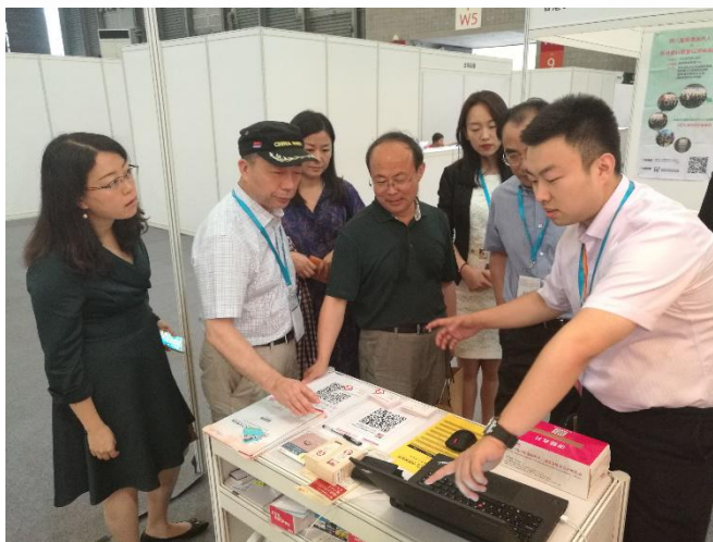
老龄办及民政部中民养老规划院领导 莅临中国养老网展台指导工作