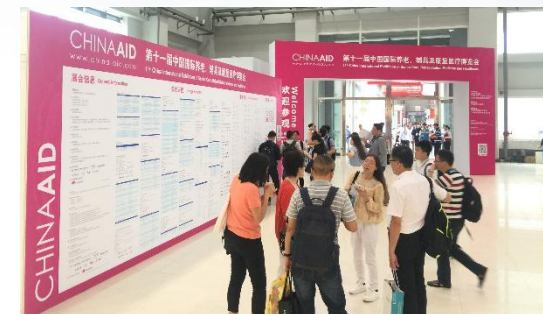
China Aid 开幕